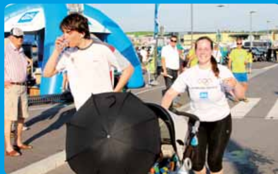
Poglavitni cilj projekta Slovenija teče je za tek navdušiti čim več ljudi različnih starosti.

Množične tekaške prireditve pod okriljem akcije so priložnost za spoznavanje novih ljudi in krajev, srečevanje s starimi znanci, za tkanje novih prijateljstev z ljudmi, ki imajo podobno življenjsko filozofijo. Hkrati je na takih prireditvah mogoče preverjati učinke prizadevanj in truda ob redni tekaški vadbi. Poleg tega pa lahko na njih tečejo vsi: od šolarjev do tistih, ki so že krepko zakoračili v tretje življenjsko obdobje, ženske, moški, otroci. Vsekakor izvrstna priložnost za aktivno družinsko preživljanje prostega časa.