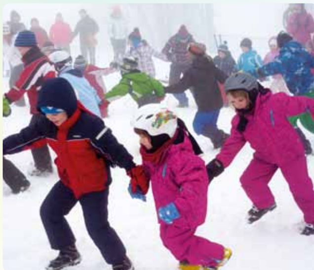
Otroci na mini olimpijadi.

mladim tekmovalcem bodisi v obliki mentorstva, zagotavljanje štipendij, socialnega sklada oziroma na drugi podoben način. Zato torej ta program želimo poimenovati »Športniki za športnike - skupaj zmoremo več« saj smo prepričani, da bomo preko projektov SOA v programe promocije športa, olimpizma in olimpijskih vrednot vključili zelo veliko število otrok in mladih po celotni Sloveniji, za izvajalce navdušili in pridobili ter če bo potrebno tudi dodatno usposobili naše nekdanje vrhunske športnike, ter na koncu preko teh dejavnosti in potencialnih novih partnerjev pridobili nekaj sredstev za podporo ali štipendije mladim športnikom. ☺