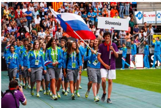
Sponzorji olimpijske reprezentance Slovenije

Organizator je na prizoriščih v Utrechtu omogočil kvalitetno izvedbo tekmovanj, pri namestitvi pa smo imeli izjemno srečo, saj smo bili nameščeni v hotelu, ki je nudil prvovrstne pogoje bivanja in prehrane. Vreme je bilo naklonjeno športnikom, ki je omogočal izenačene pogoje, tako da si športniki ob močni konkurenci niso smeli privoščiti napak. Izplen 11. kolajn za reprezentanco Slovenije je zelo dobra popotnica za nadaljnje delo, tako da vodstvo reprezentance čestita športnikom in njihovim trenerjem za dobre dosežke na tekmovališčih in se zahvaljuje vsem strokovnjakom, ki so sodelovali v projektu.