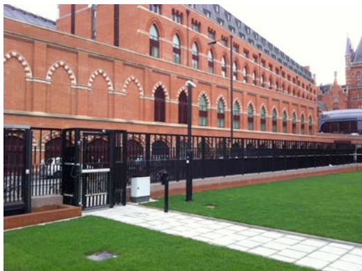
Slika: Vhod v British Library s postajo St. Pancras v ozadju.

Slovenska hiša bo v okviru Olimpijskih iger v Londonu delovala v okviru British Library-a, neposredno ob postaji St. Pancras v predelu Bloomsbury.