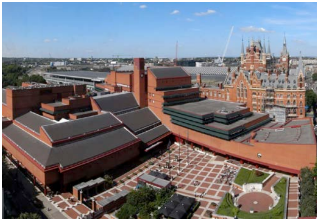
Slika: Slika British Library

Z lokacijo neposredno ob postaji St. Pancras bo Slovenska hiša vidna milijonom obiskovalcev, saj se bo v eni uri v in iz olimpijskega parka prepeljalo 25.000 obiskovalcev.